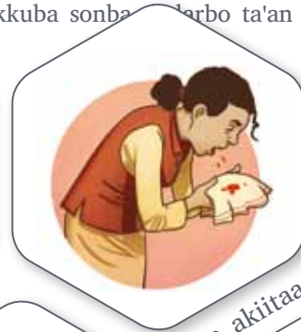
qufaa akiitaa qabuu