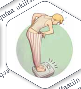
ulfaatiin qamaa hirachuu